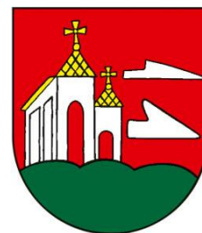
Obrázok 3 Erb obce Turnianska Nová Ves

Erb obce Turnianska Nová Ves tvorí V červenom štíte na pravom a strednom vrchu zeleného trojvršia strieborný, zlato zastrešený strieborný kostol, vľavo s pristavenou podobnou kaplnkou, vľavo sa vznášajú strieborné nad sebou položené obrátené radlice.