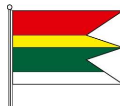
Obrázok 4 Vlajka obce Turnianska Nová Ves

Vlajka obce Turnianska Nová Ves pozostáva zo štyroch pozdĺžnych pruhov vo farbách 1/3 červená, 1/6 žltá, 1/3 zelená a 1/6 biela. Vlajka má pomer strán 2:3 a ukončená je troma cípmi, t.j. dvoma zástrihmi, siahajúcimi do tretiny jej listu.