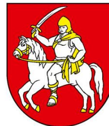
Obrázok 6 Erb obce Žarnov

Erb obce Žarnov tvorí V červenom štíte vojak v striebornom šate, zlatej prilbe a zlatom plášti, v pravici so striebornou šablou so zlatou rukoväťou, sediaci na striebornom zlatokopytom neseslanom koni so zlatou ohlávkou a uzdu